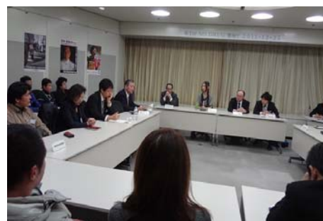
合同ミーティングの様子