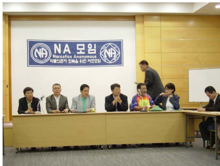
洪川（ホンチョン）で行われた 韓国NA一周年研修会会場にて 【お知らせ！！2006年4月、釜山(プサン)において 日韓合同のウィークエンド・ギャザリングを実施する 予定です】