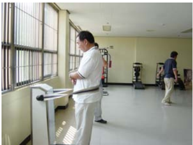
国立釜谷（ブコク）病院のリハビリ室にて