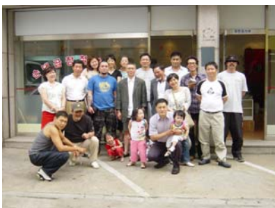
仁川（インチョン）のTC（治療共同体）の中にあるモチ工場前で