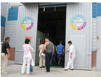
仁川（インチョン）のTC（治療共同体）の中にあるモチ工場