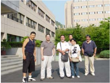
国立釜谷（ブコク）病院にて